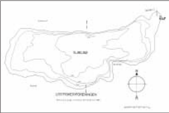
LF's kort fra Tidende april 1988, side 13264-65