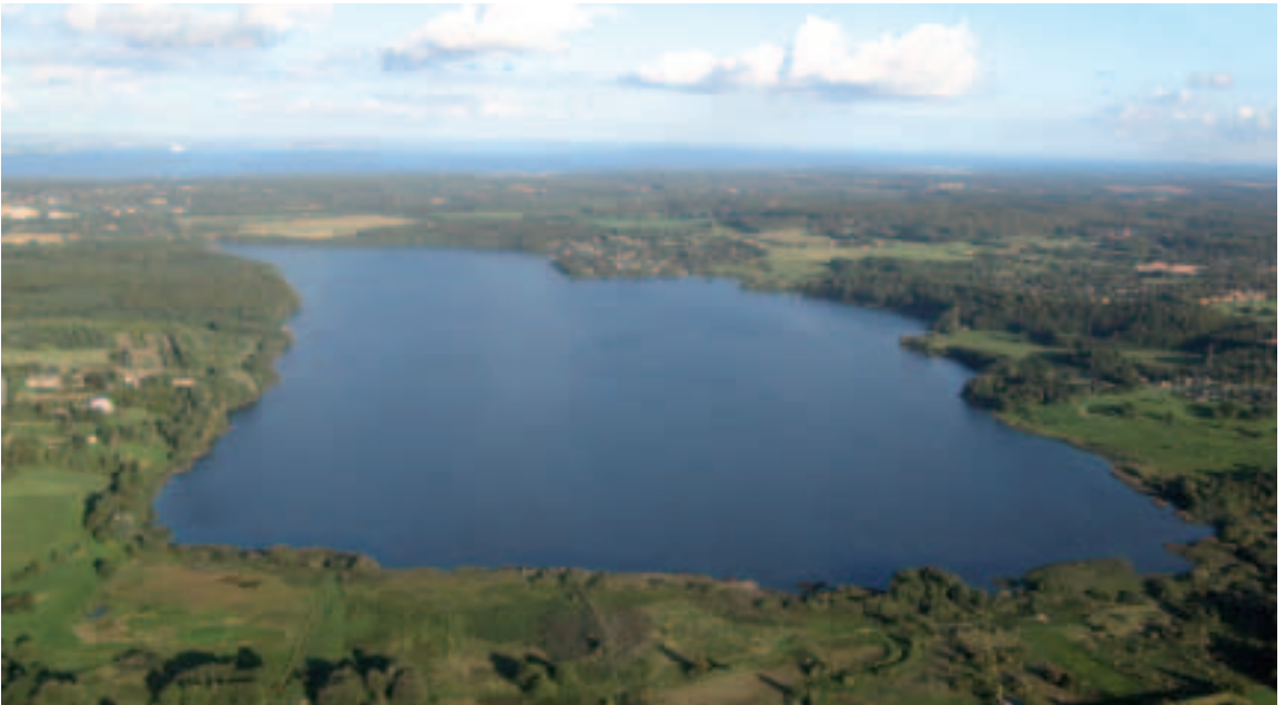
Sjælsø set fra oven. Øresund i baggrunden. 14.09.2010