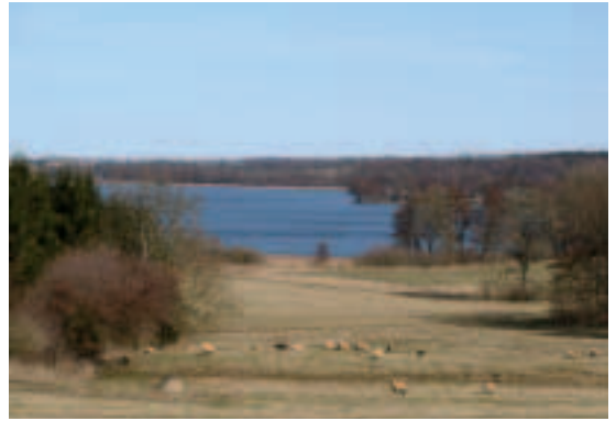
Udsigt mod Ravnsnæs. 06.04.2009.

Det er svært at sige hvor fiskene befinder sig, men redaktøren prøver gerne området omkring Ravnsnæsset, efter at have trukket med et par woblere derhen, for at se om gedderne er til at tale med. Gedderne er stadig i en spisevenlig størrelse. Aborrerne er stadige pæne i størrelsen, men ganske svære at finde, da de kan opholde sig alle steder i søen. En lystfisker jeg snakkede med, efter at han kom tilbage fra en tur til den vestlige