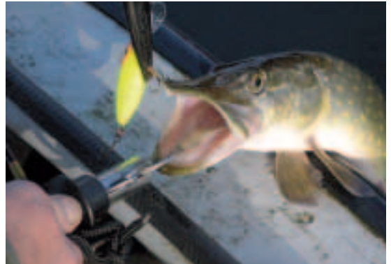
Lille og grådig. 07.11.2010.