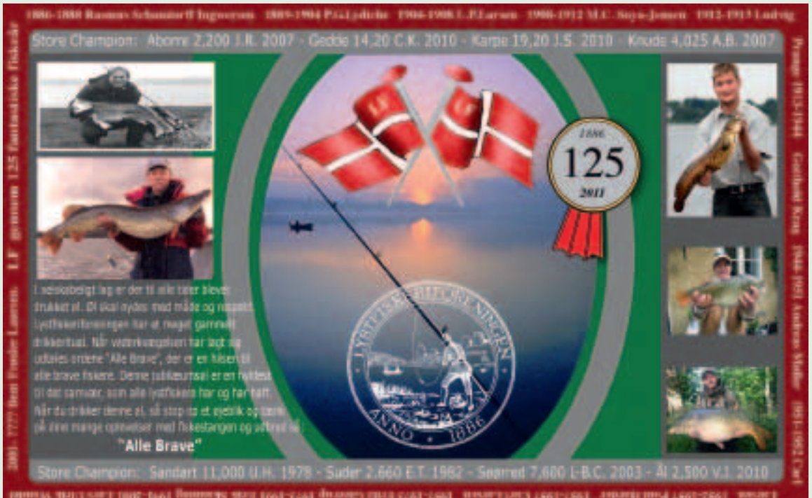
Jubileumsøletiketten. Design: Henrik Tørnquist