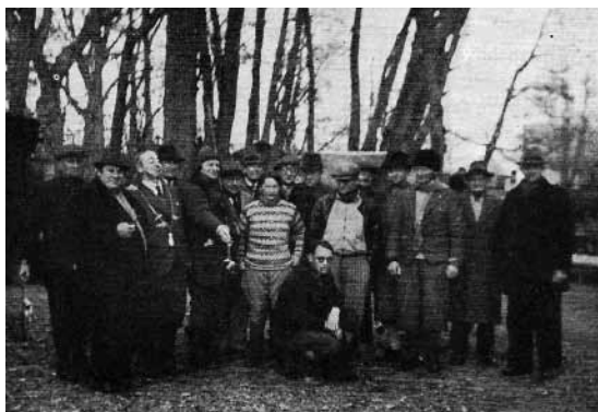
Medlemmerne af Aborreklubben anno 1940. Optaget efter konkurrencen d. 30. november 1940. Desværre har originalfotoet en del skader, så fotoet er kopieret fra Lystfiskeri-Tidende.

blandt ligesindede, som vidste, hvor stor en hæder, der her var tale om. Vinderen fik sit navn og vægten på aborren slået ind på en lille aborre i letmetal, som derefter blev fastgjort i kæden, som et evigt bevis på hæderen. Den type af toiletter findes ikke mere, så skulle traditionen genfødes, måtte man på jagt efter resterne af en gammel væghængt cisterne. Kunne man ikke finde en sådan indretning, kunne et alternativ være at hænge indmaden fra et væghængt lavtskyllende Ifö toilet om halsen på vinderen. Nogle vil måske endda foreslå, man anvender et toiletsæde eller på ligefremt dansk – et lokumsbræt. Nok en dårlig idé, da det kan give infiltrationer i nakken. Samtidig er de moderne sæder udstyret med et låg, som kan give buler, når det slås ned. Blot strøtanker om mulighederne for at finde et passende alternativ til hæderskæden.