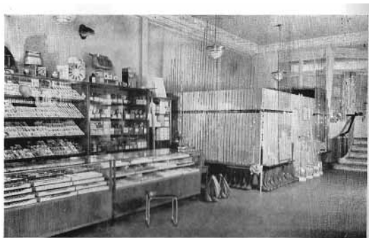
velkommen i F.I.B.'s FISKERIAFDELING