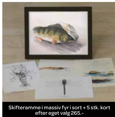
Skifteramme i massiv fyr i sort + 5 stk. kort efter eget valg 265.-