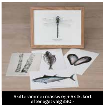
Skifteramme i massiv eg + 5 stk. kort efter eget valg 280.-

Naturportrætter i akvarel af fisk, skaldyr, træer og planter i 1:1 fra den danske og nordiske natur. Nu som billedkort til billedvæggen, som gave eller som en hilsen. Se udvalget på www.nordic-reflections.dk LF-særpriis: -10%. Skriv LF2022 ved bestilling.