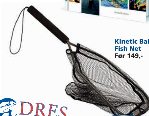
Kinetic Bait Fish Net Før 149,-