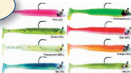
Storm 360GT Searchbait Minnow 18gr Før 59,95