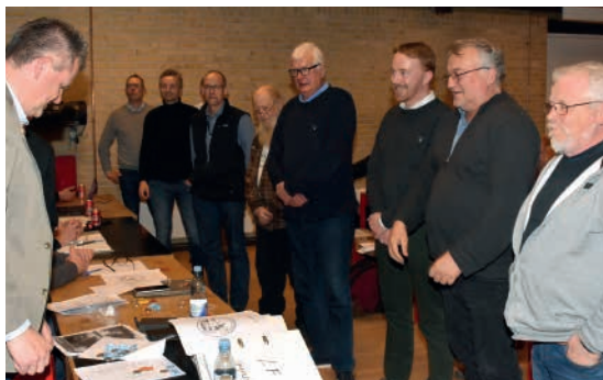
Tillykke til alle 25 års jubilarer.