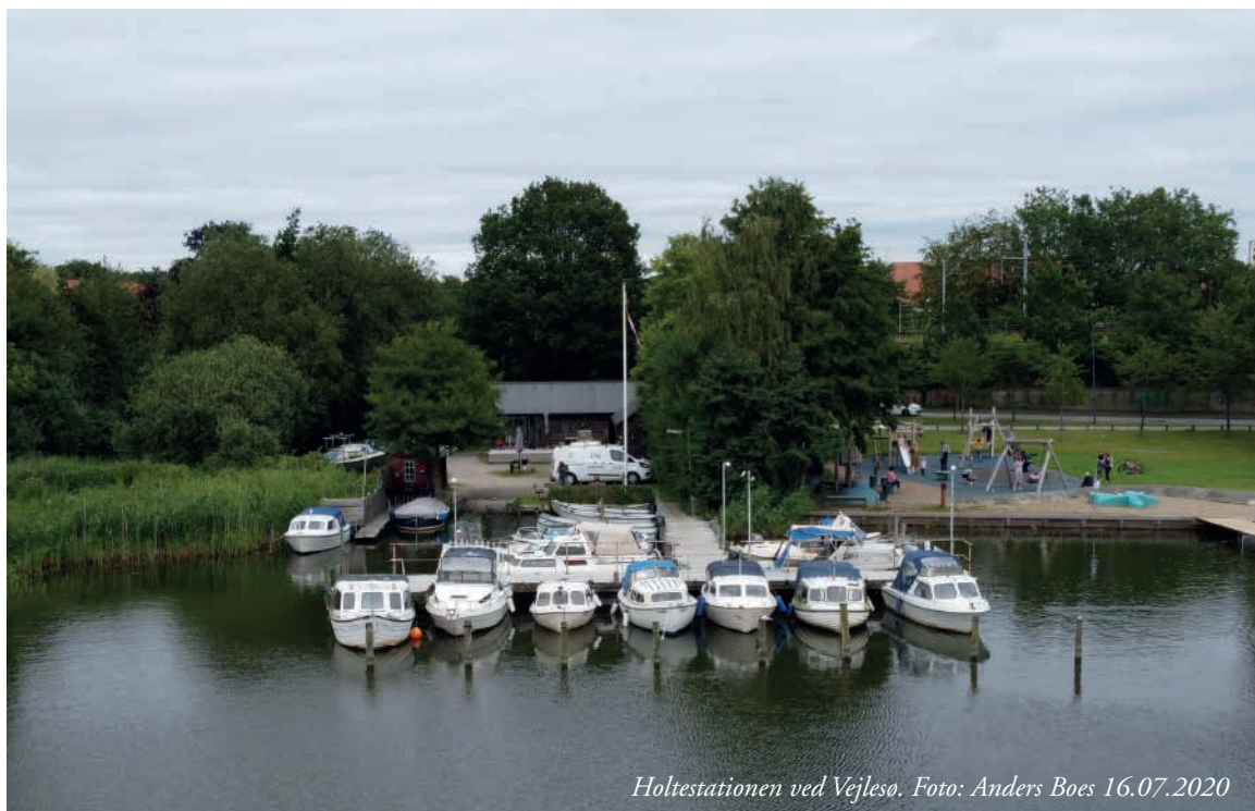
Holtestationen ved Vejlesø.

Nærmere oplysninger herom fås hos overinspektøren, der varetager administrationen af bådpladserne.