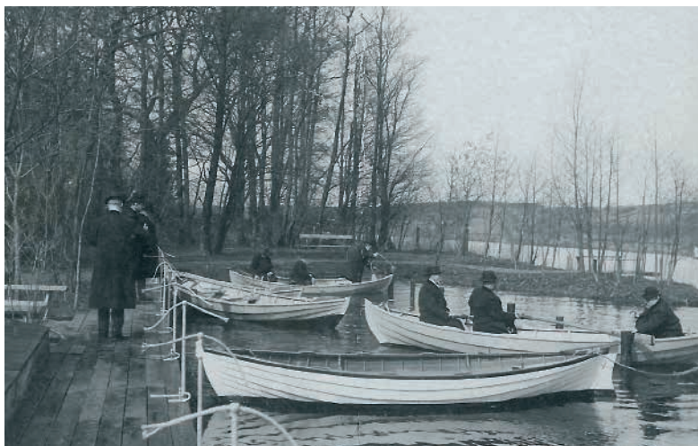
13. april 1903 indvies den nye Frederiksdal station. Bemærk stænderne med rebene. De er stadig monteret på broen. Blot er hamperne udskiftet med nylonreb.