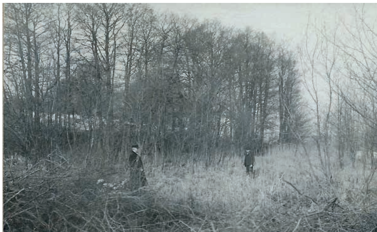
Rørmosen besigtiges 9. marts 1903, dagen inden gravearbejdet går i gang. Det var noget af et morads, der skulle omdannes.