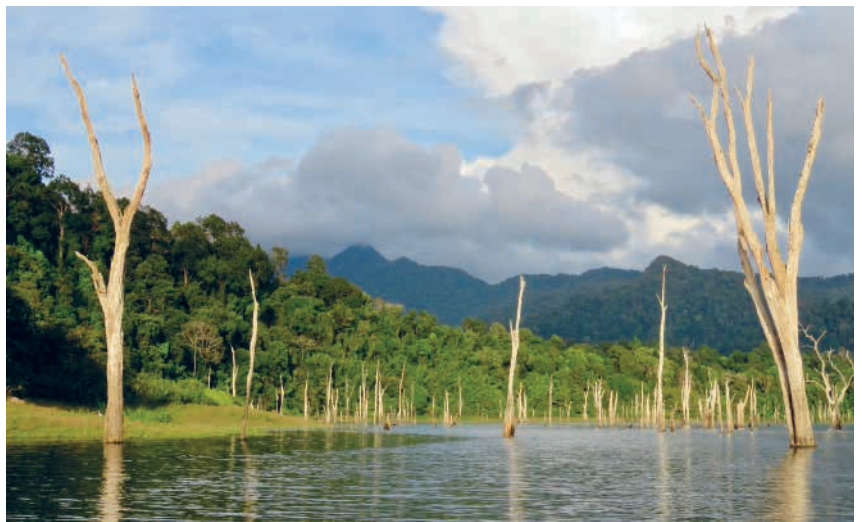
Den lavvandede del af søen hvor snakehead gemmer sig.

Livet er skønt. Skriv endelig til mig hvis nogen er blevet inspireret til en tur i junglen. Jeg hjælper gerne med gode råd til evt. planlægning. Steenr@rocketmail.com