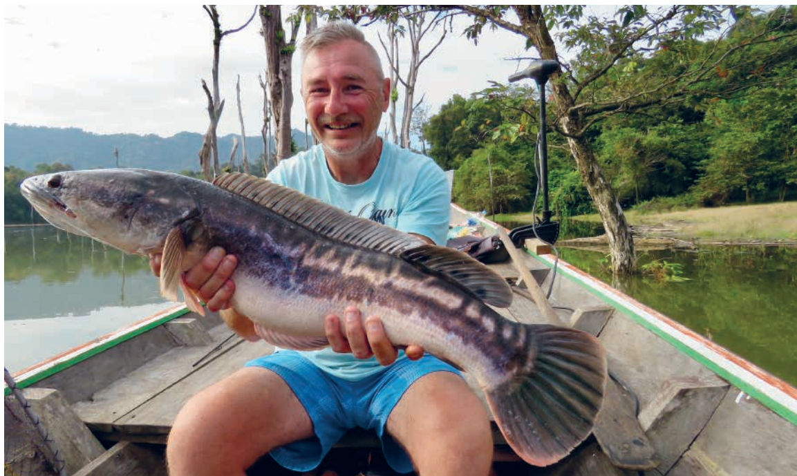
Snakehead på 5-6 kg, der formåede at knække en fin stang.

Efter ca. 30 min sejlads med den store motor, når vi til den lavvandede del af søen. Elmotoren bliver monteret, og vi "lusker" rundt i små vige, ved sivøer og ved små å-udløb. 6,5-fods Loomis stænger, Shimano fastspolehjul og Poppere med grødeskærmet kroge, det er hvad der skal til, her mellem grene, sivtuer og træstammer. Leje af grej er inkl. i prisen på disse ture. Der bliver kastet på et hvert oplagt snakehead skjulested, vandet ligger blankt og fuldstændigt stille.