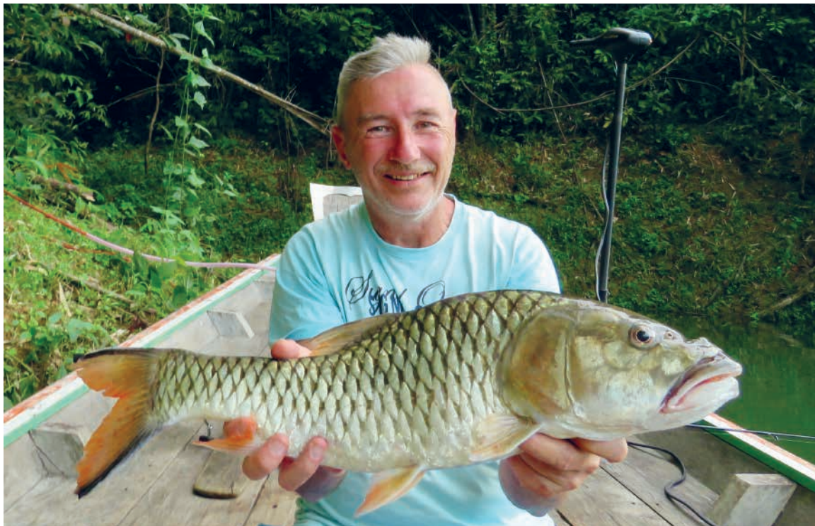
Hampala Barb, fanget på bundmede med levende agn.

Den turarrangør vi har brugt mange gange, er 100 % seriøs, og prisen er lidt over 3300 kr. pr. mand for en tre-dages tur i junglen. Prisen inkluderer alt: Transfer med bil frem og tilbage fra hotellet, fra Khao Lak er det en tur på ca. 2,5 times kørsel, "egen" longtail boat, med skipper/guide i alle tre dage. Overnatning i Ranger Camp med egen bambushytte i 2 nætter. Fuld forplejning, morgenmad, frokost og aftensmad. Ubegrænset ikke alkoholiske drikkevarer, flaske vand, cola mm. fra køleboksen i "egen" longtail båd. Kaffe/the i den primitive "rangerkantine" samt alt hvad man har brug for