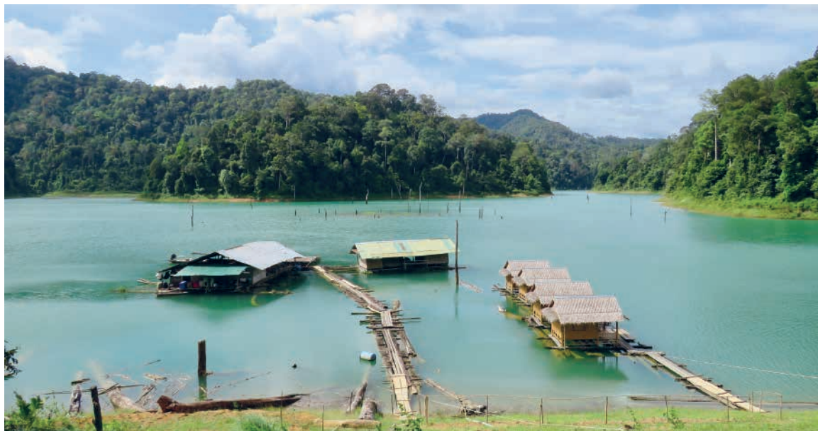
Ranger Camp i junglen hvor vi bor.

Det er vildt, det er spændende, og det er helt fantastisk at sejle ud i det gryende dagslys og se/høre junglen vågne. Abernes skrig i trætoppene, elefantens massen rundt i underskoven, sambar hjortens gennemtrængende skrig og vingesusene fra de store næsehornsfugle. Vi runder et hjørne og pludselig står der to tapirer og morgenbader. Ren idyl.