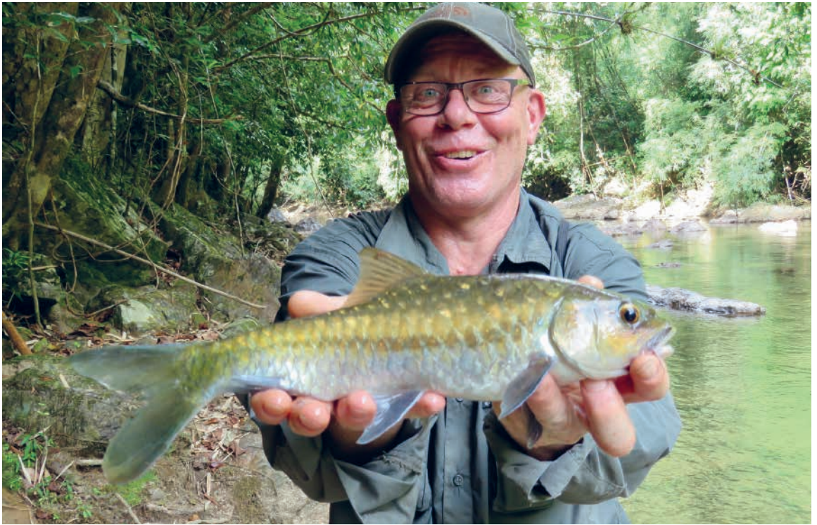
Min fiskemakker med fin lille mahseer, Fjernøstens svar på stalling.

af fiskegrej, stænger, hjul og endegrej.