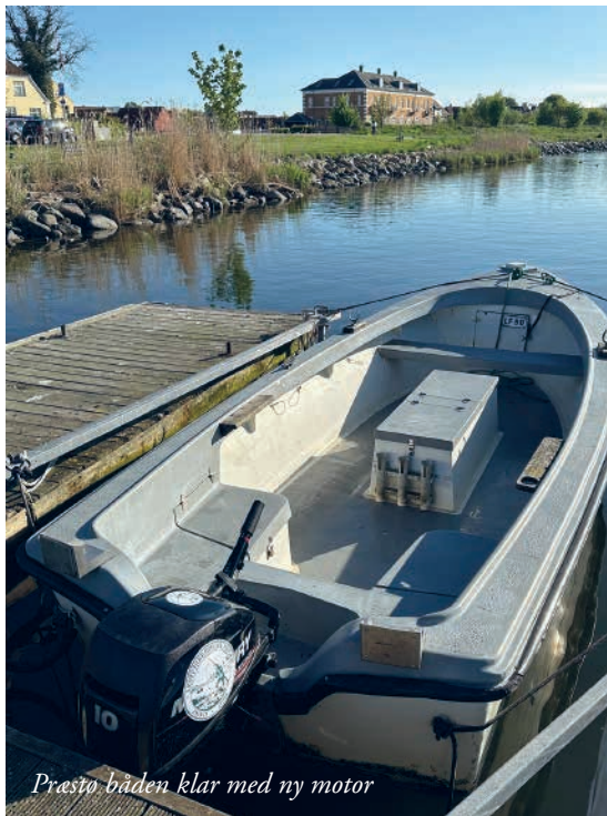
Præstø båden klar med ny motor

Den havde vi dog lidt opstartsproblemer med, så vi gik desværre glip af havørredfiskeriet på fjorden i april måned, som kan være rigtig fint. Vi fik dog løst problemet og motoren kørte derefter uden problemer.