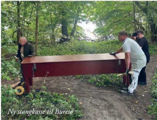
Ny stangkasse til Buresø

indskrevet en aborre på 1,50 kilo i rapportbogen for november måned, så der er bestemt noget at komme efter.