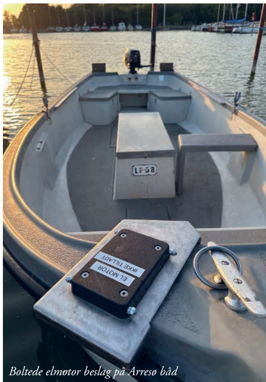
Boltede elmotor beslag på Arresø båd

Vi håber på, at det igen bliver tilladt at anvende elmotorer, når der er faldet lidt ro på det hele. Vi er i fin dialog med skovfogeden, og vi tror på det lykkes.