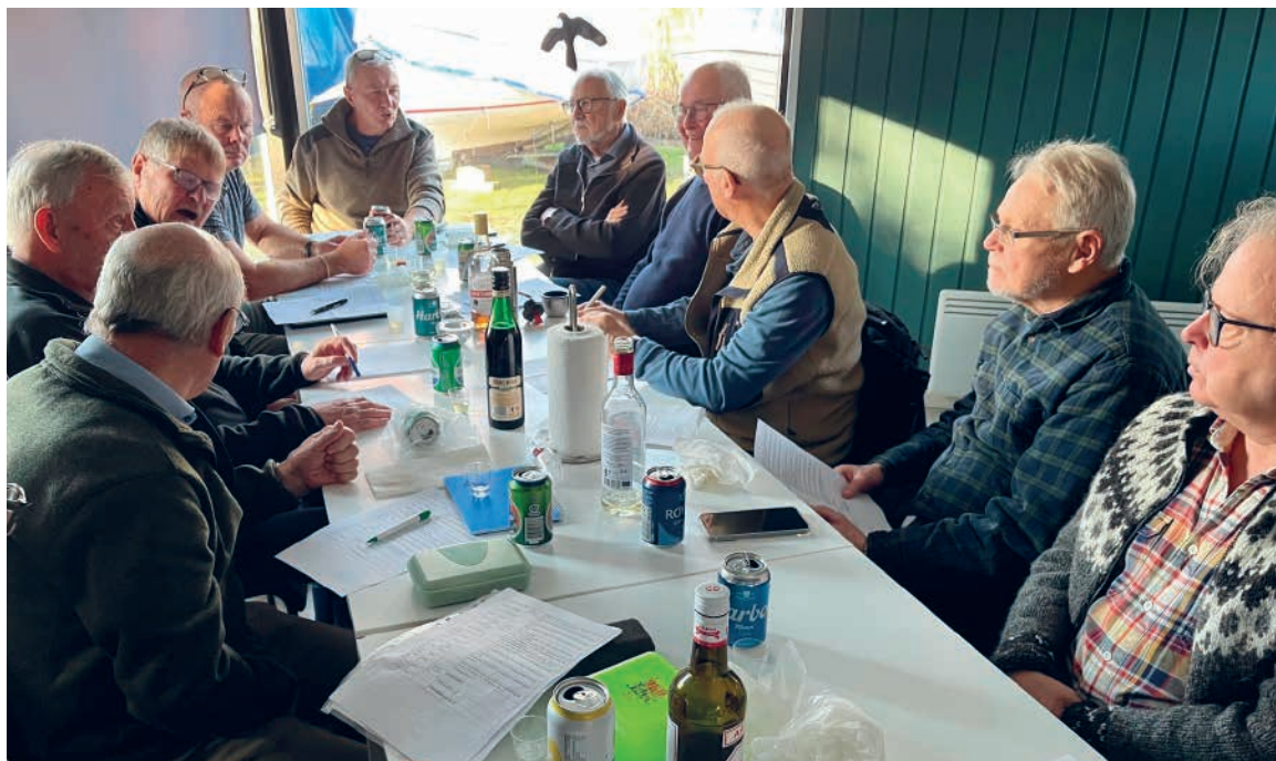
Planlægningsmøde i Holte den 19. januar 2026